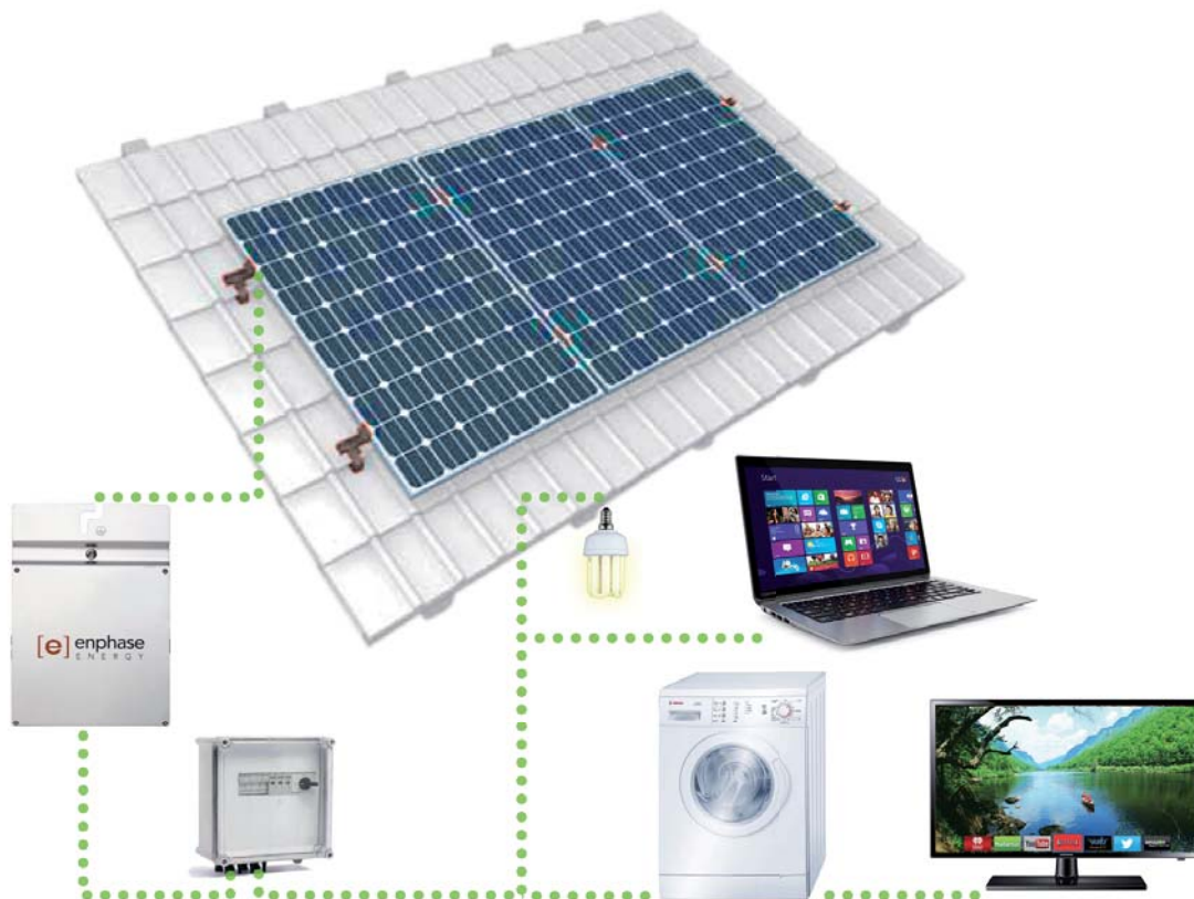
Schéma non contractuel

Kit solaire photovoltaïque pour l'autoconsommation comprenant les panneaux solaires 260Wc, les micro-onduleurs ENPHASE M ou l'onduleur SMA, le boîtier AC + parafoudre, le kit de pose en surimposition ou en châssis.